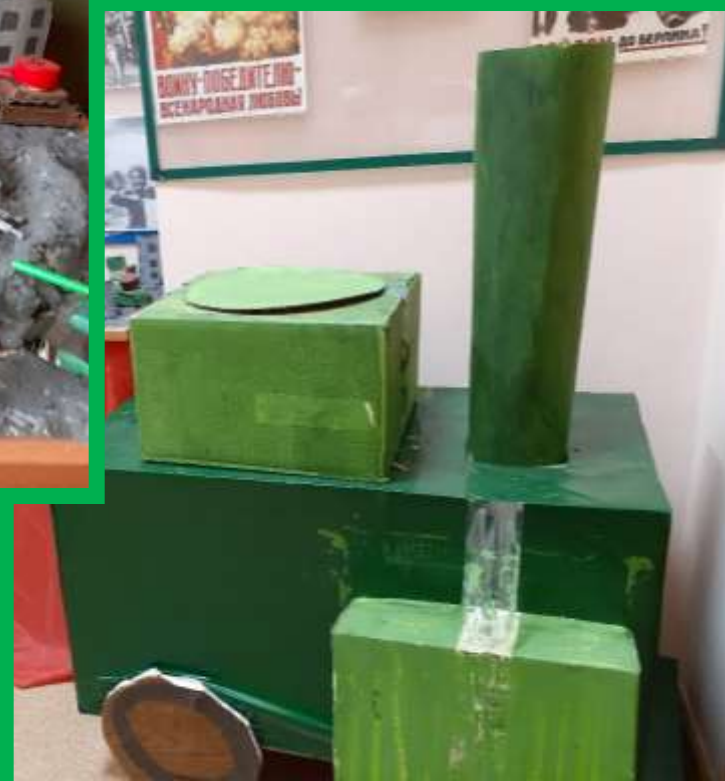
Макет «Полевая кухня»