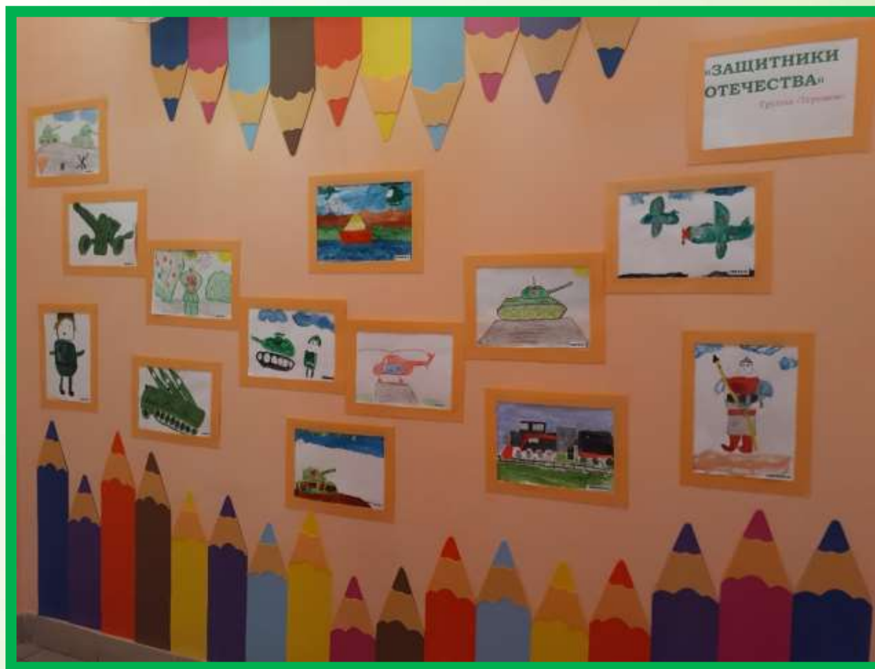
«Выставка детских рисунков «Защитники Отечества»