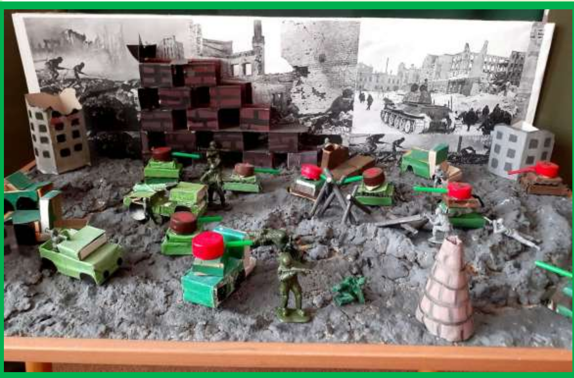
Макет «Сталинградская битва»

Пополнение музея «Боевой славы» экспонатами, изготовленными руками детей